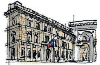
ENTRA NEL CONSIGLIO COMUNALE DI MILANO