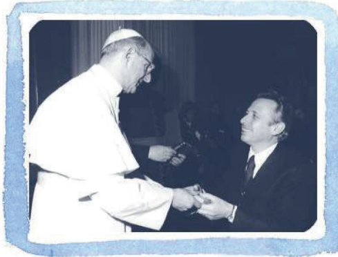
CONTRASTI CON L'ARCIVESCOVO MONTINI, FUTURO PAPA PAOLO VI