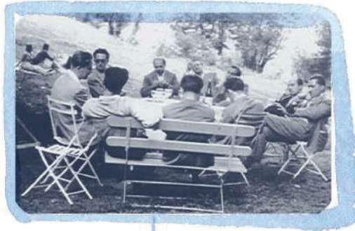
NASCE A BELGIRATE LA CORRENTE « LA BASE »