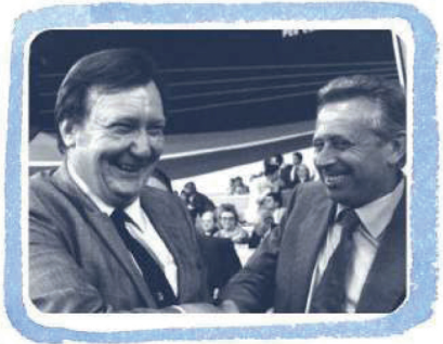
SI COS' IL LABOR. AL SINCRO

GOLPE IN CHILE A FIANCO DEI PERSEGUITATI POLITICI