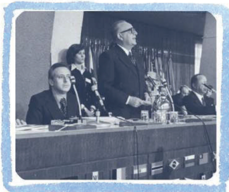
PRIMA CONFERENZA NAZIONALE DELL' EMIGRAZIONE