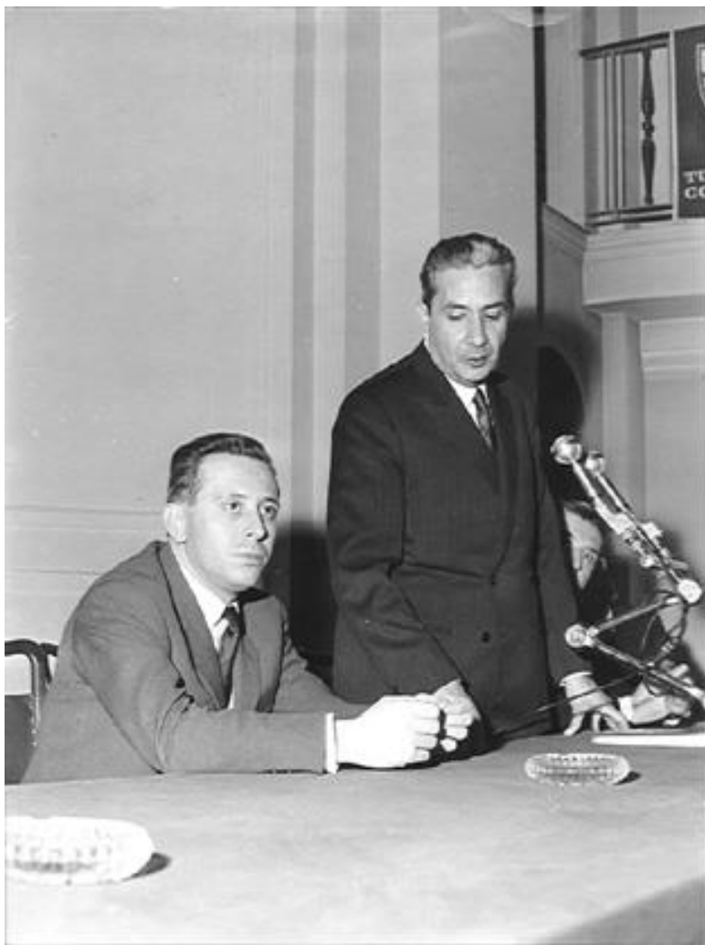
Il papa, Luigi Granelli, con Aldo Moro