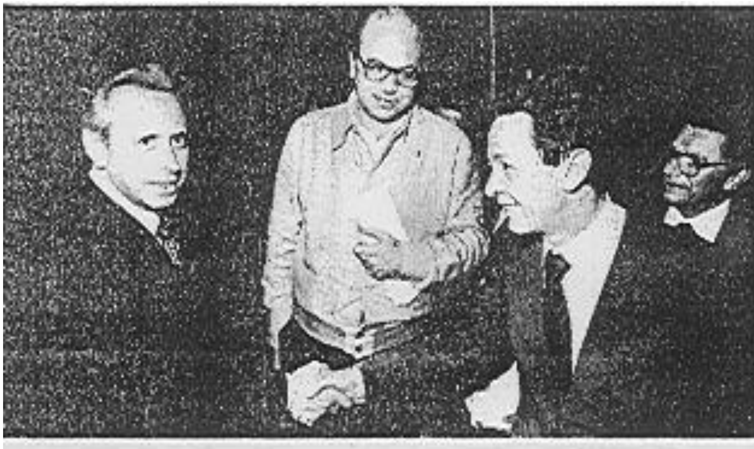
Il papa, Luigi Granelli, con Berlinguer e Craxi