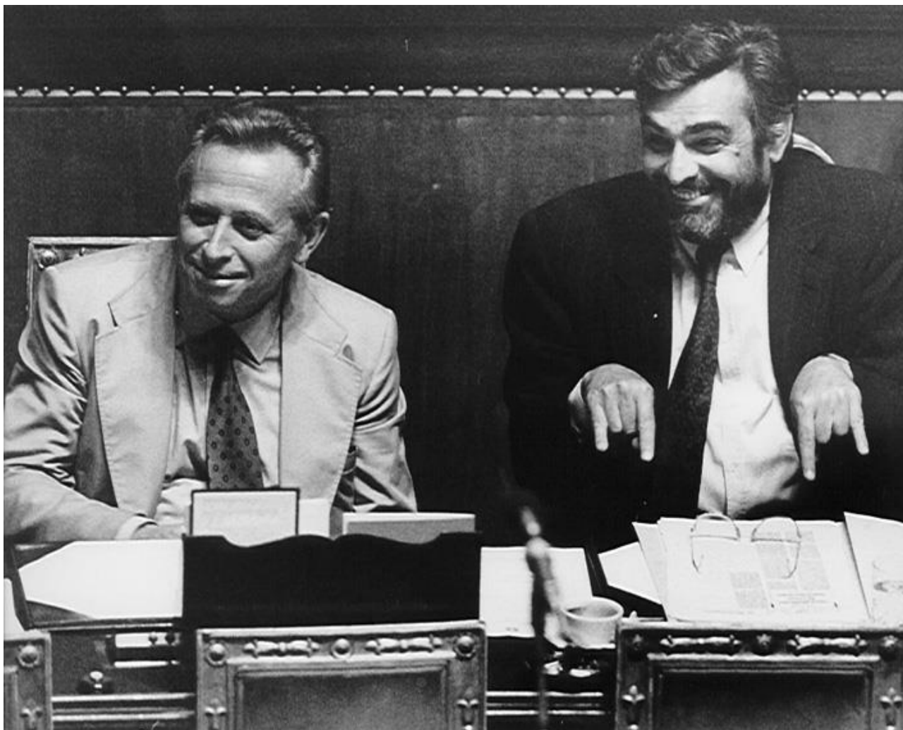
Il papa, Luigi Granelli, Ministro delle Partecipazioni Statali nel governo Gorla (1988)