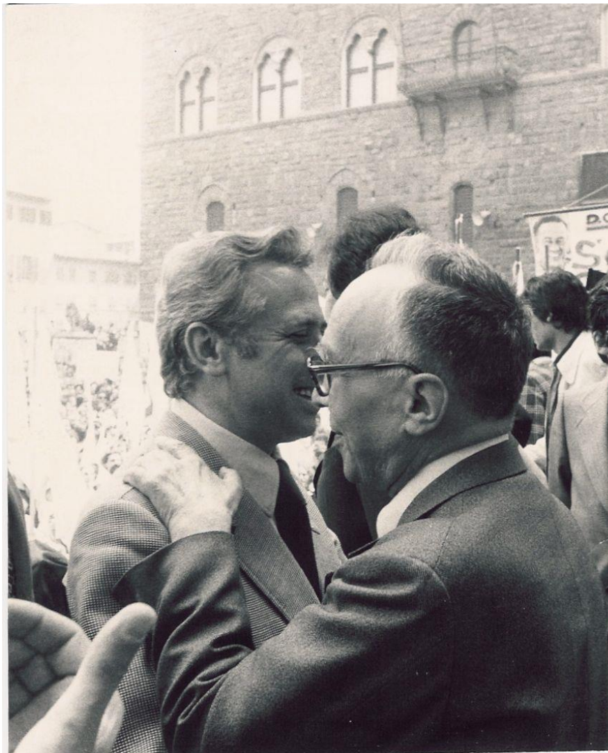
Il papa, Luigi Granelli, con Giorgio La Pira a Firenze