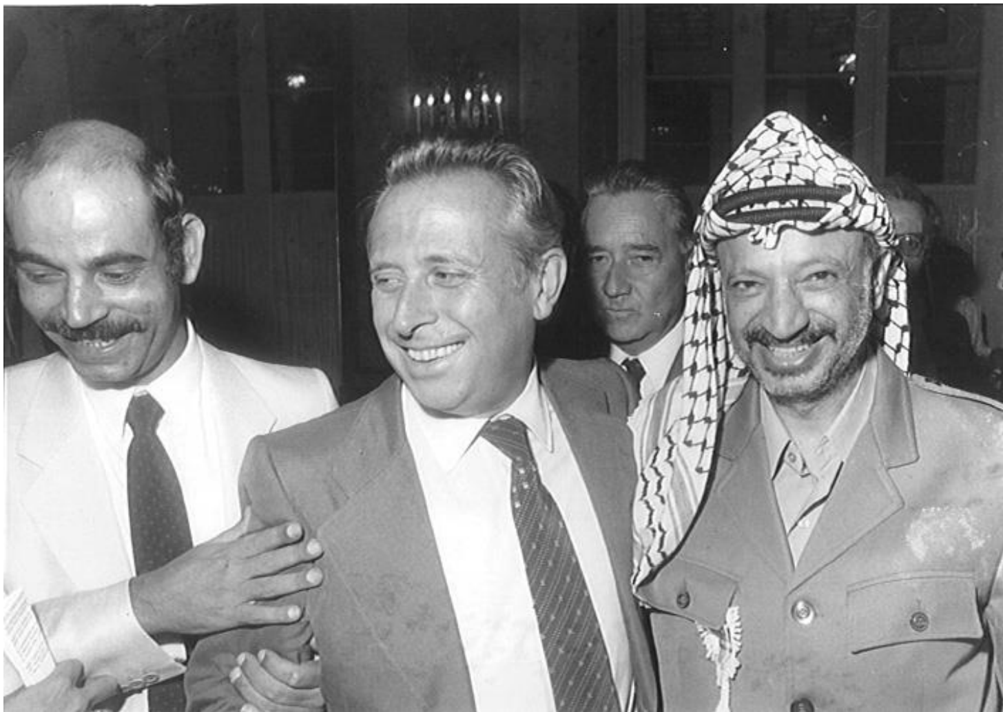
Il papa, Luigi Granelli, con Arafat – presidente dell'OLP