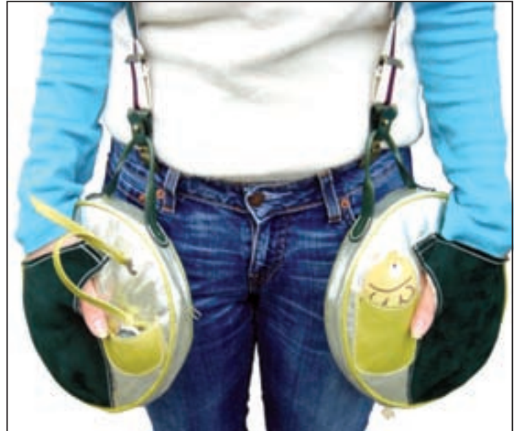
Self Exploiter , travail de B.Na, Master Fashion Design