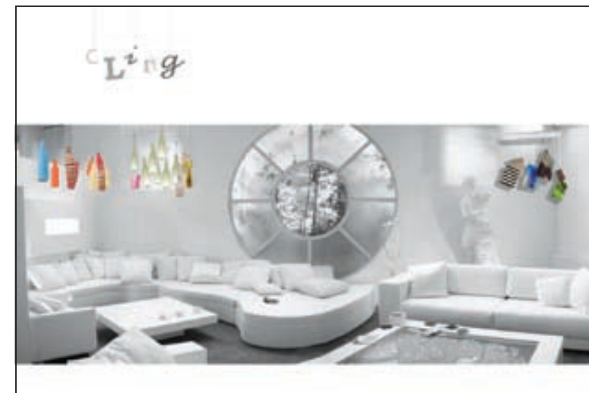
Cling , travail de M.Rois Diaz, Master Design