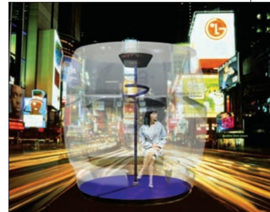
Transpose , travail de E. Koronyo, Master Design