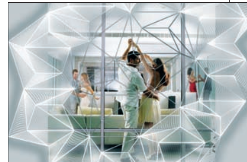
Center Cell , réalisation de E. Zeynep, Master Design