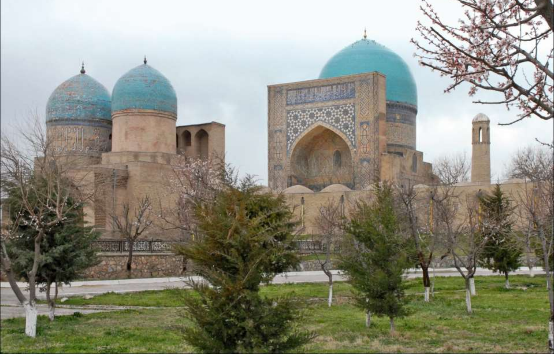
Complesso della moschea di Kok-Gumbaz a Shahrisabz (Uzbekistan)