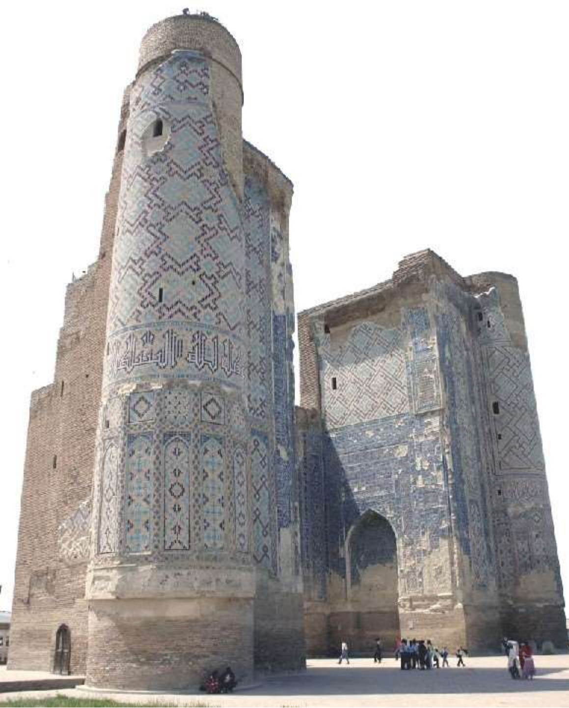
Aq-Saray Palace o palazzo di Tamerlano (Amir Timur il grande) a Shahrisabz – le decorazioni in «cufico quadrato» (Uzbekistan)