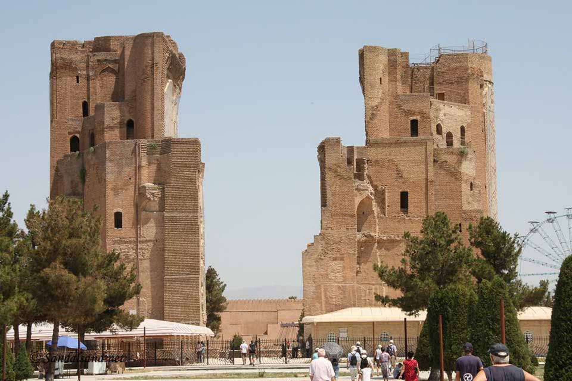
Aq-Saray Palace o palazzo di Tamerlano (Amir Timur il grande) a Shahrisabz (Uzbekistan)