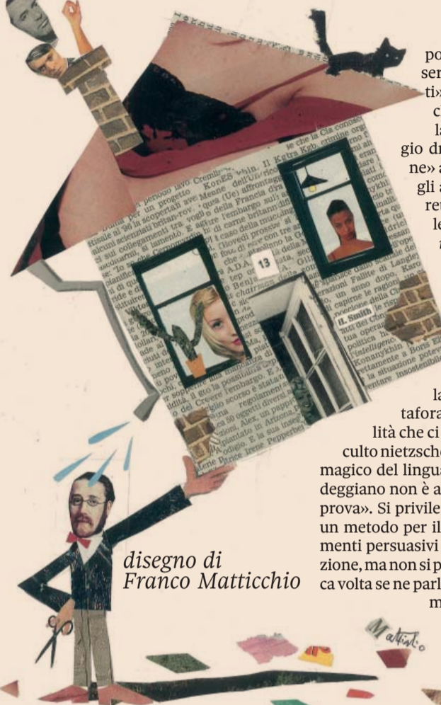
disegno di Franco Matticchio

neo» (per dirla con Ezio Raimondi, citato nel libro, in termini che ripetono fedelmente la lettura che della Retorica aristotelica aveva dato Heidegger).