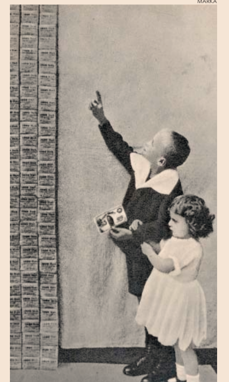
PER UN DOLLARO | Iperinflazione in Germania dopo la Prima guerra mondiale