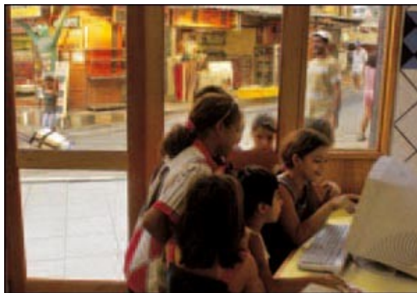
Un internet-point in Brasile.

«La metafora usata in passato per definire la Rete, come una biblioteca infinita, oggi va integrata con quella della piazza dove interagire e incontrare gli altri», scrive Lorenzo Cantoni. Le due finalità per cui si "abita" la Rete – la conoscenza e la relazione – nell'esperienza della Chiesa si integrano a vicenda e, invece di prendere il posto delle vecchie forme di comunicazione, creano efficaci sinergie: «Audio e video, per esempio, stanno rafforzando la loro persistenza attraverso i servizi website e podcasting ».