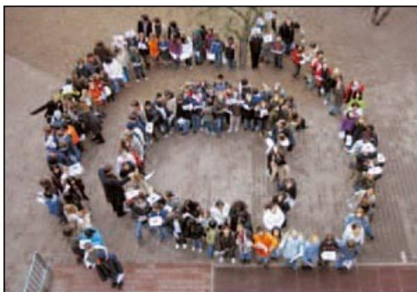
Studenti formano il simbolo della chiocciola (foto F. Bruns/AP/La Presse).