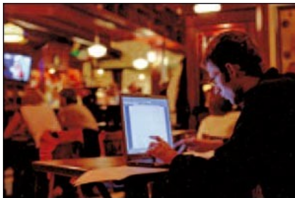
Un giovane lavora al pc all'interno di un pub.