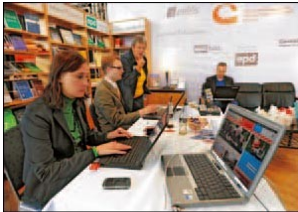
Al computer in ufficio.