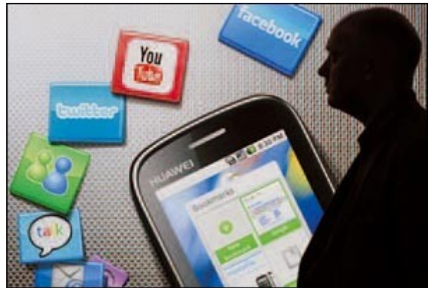
La pubblicità di un congresso di telematica.

È questo il vero grande nodo con cui la Chiesa deve fare i conti. Al di là dell'utilità tecnica del mezzo, come dicevamo all'inizio, si tratta infatti di capire il linguaggio e le regole del mondo di cui parliamo. «La tecnica ha una dimensione problematica che va gestita, che richiede maturità e non infantilismo. Le polarizzazioni, tecno-fan o tecnofobici , non aiutano a comprendere il mezzo, che ha una tale complessità che non può essere banalizzato», mette in guardia Andrea Granelli , consulente di innovazione, autore di numerose pubblicazioni sull'argomento e, tra le altre, del volume Il Sé digitale .