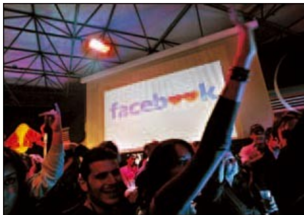
Raduno di una community di Facebook (foto C. Morelli/Emblema/Sintesi).

«La Rete è una novità tecnologica e questa sembra essere la cosa che più attrae chi si avvicina al fenomeno», spiega padre Spadaro. «Eppure, facendo una riflessione più attenta, ci si rende conto che è un modo per dare un volto nuovo a desideri che hanno sempre fatto parte dell'uomo: il bisogno di relazione, di condivisione, di comunicazione, di raccontare storie». Spadaro, autore tra l'altro del fresco di stampa Web 2.0 Reti di relazioni (Paoline), è il primo navigatore che ci offre qualche coordinata per definire una mappa che sia di orientamento nel digitale.