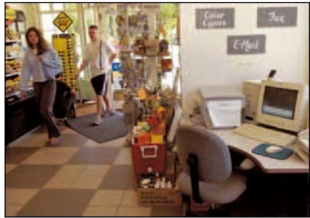
Un internet-point all'interno di un negozio.

In diversi articoli pubblicati su Civiltà cattolica , padre Spadaro parla del parallelo suggestivo tra la Rete e la Chiesa che ha spinto alcuni a parlare di una «teologia di Twitter », facendo riferimento al famoso social network . «Poiché la teologia riflette sull'esperienza del credente, il quale vive sempre più questo rapporto con la Rete, le due realtà non possono non entrare in dialogo. Anche perché la Rete contiene due elementi importanti per la Chiesa: la comunicazione di un messaggio e la relazione tra persone». Ma il gesuita rileva che, seppur suggestiva, l'immagine, che richiama quella delle vite e dei tralci, non tiene conto di una differenza radicale: la Rete vive in una dimensione orizzontale, sostanzialmente è autoreferenziale, mentre la Chiesa è una Rete bucata dall'alto, vive una dimensione verticale, perché riceve un messaggio che poi scorre all'interno dei tralci. Tuttavia, «quest'immagine può essere proficuamente utilizzata perché la Rete, come la Chiesa, è viva nel momento in cui i nodi funzionano e la comunicazione passa».