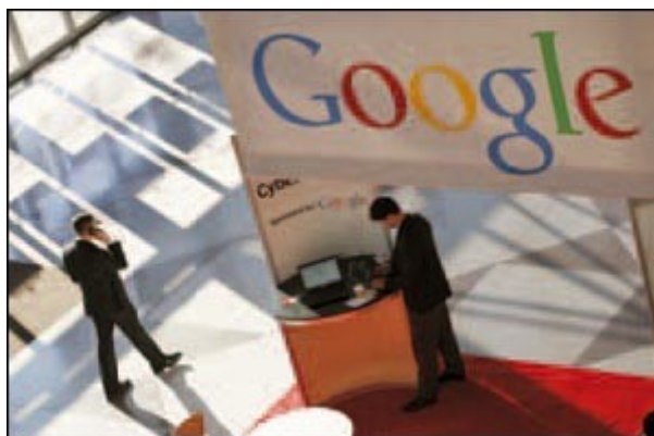
Lo stand di Google a una convention.

Passando poi dal livello diocesano a quello della Chiesa universale, Cantoni fa questo tipo di analisi: se si può dire che il Concilio Vaticano II è stato il primo evento mediatico in cui il dibattito sui contenuti è stato seguito dai fedeli di tutto il mondo grazie ai mass media, con l'avvento del digitale «si apre una nuova fase del gioco» comunicativo: un cattolico – sia esso un vescovo, un prete o un semplice laico – grazie alla Rete può avere un accesso immediato ai documenti e alle dichiarazioni e farsi un'idea sulle vicende che riguardano il governo centrale della Chiesa; i vecchi mediatori, coloro che prima avevano i testi di prima mano, giocano un ruolo secondario, mentre nuovi attori si sono imposti – mailing list , portali, agenzie di stampa on line, blog personali – nel dare e commentare i fatti ecclesiali. Non a caso, durante la presentazione del volume, alcuni vaticanisti citavano dei blog che, sebbene sotto pseudonimi dietro i quali non si sa quale mano si nasconda (il più famoso è il blog di Raffaella, www.paparatzinger3-blograffaella.blogspot.com ), danno informazioni e rivelano retroscena vaticani al punto da essere diventati una vera e propria fonte per gli addetti ai lavori.