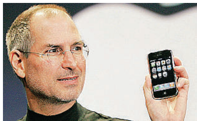
Versatile Steve Jobs, amministratore delegato di Apple, alla presentazione del cellulare iPhone, il 9 gennaio scorso

lizzabile ancora al 100% in Italia, dove la copertura Wi-fi è parziale.